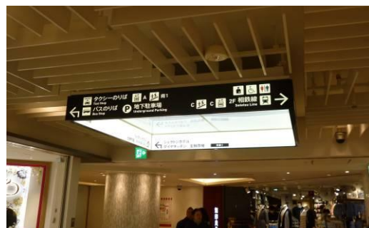
館内 方向案内サイン

全館の案内サインを刷新しました。地下1階エリアの案内を特にわかりやすく大幅に強化し、駅や集客施設へ円滑にご案内。横浜駅西口の「街」に通ずるゲートウェイの役割を果たします。