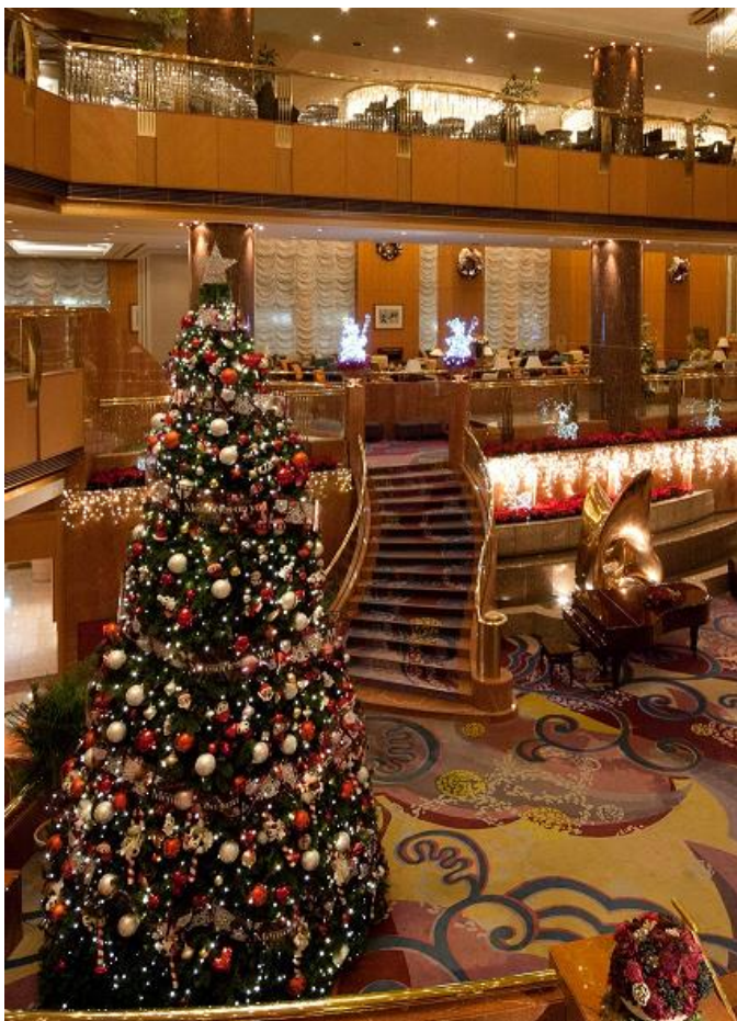
(メザニンロビーのクリスマスツリー)

その他、期間中12月20日（土）から24日（水）の4日間、ツリーの下で「Christmas Lobby Concert」を開催します。クラシックやジャズ、合唱やゴスペルなど、様々なアーティストがクリスマスシーンに添える素敵な音楽を演奏いたします。