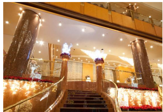
(らぶすたスポット)