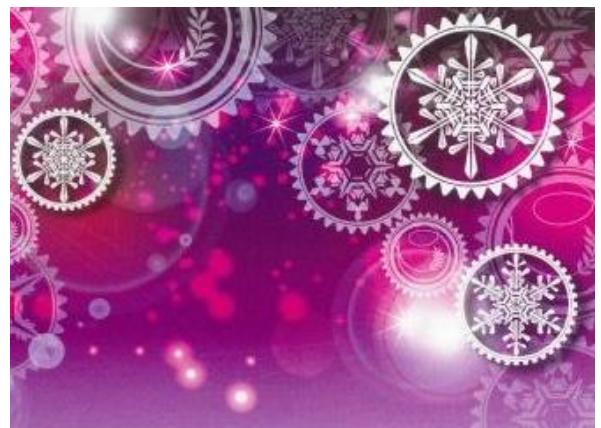
(歯車のイルミネーション)