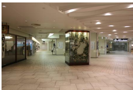
【現状】 相鉄ジョイナス B1(三角広場)