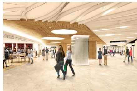
【リニューアル後】 新生「相鉄ジョイナス」B1(三角広場)