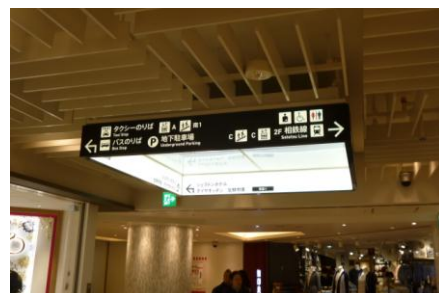
【リニューアル後】 館内 方向案内サイン