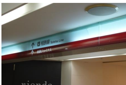
【現状】 館内 方向案内サイン