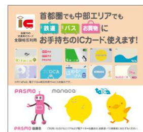
ポケットティッシュのデザイン