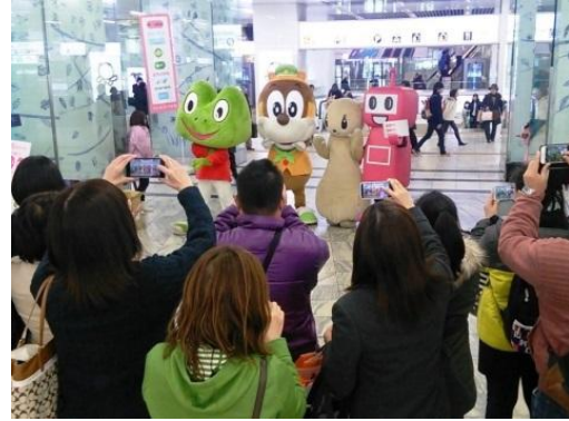
昨年12月に実施した九州エリアでの様子

「PASMO」・「manaca（マナカ）」・「TOICA」は、鉄道やバス、商業施設などにご利用いただけるICカードです。