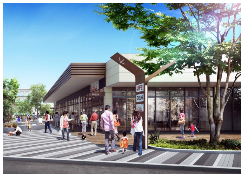
南万騎が原駅前（商業施設部分）の完成イメージ