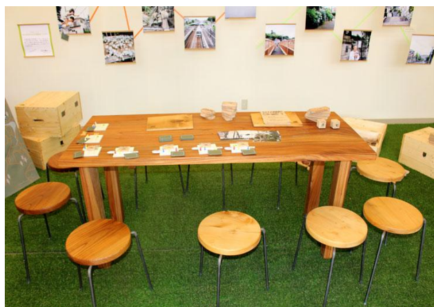
街路樹を活用し製作したテーブル・イス

南万騎が原駅周辺リノベーションプロジェクトを行うにあたり、40年前の開業時から街とともに育ってきたクスノキやケヤキ、イチョウなどの街路樹を伐採する必要がありました。地域や街路樹、駅に対して今まで以上に愛着を持ってもらうことを目指し、これらの街路樹を活用して駅前商業施設（相鉄ライブ）に新たに設けたエリアマネジメント拠点「みなまきラボ」で利用する家具や積み木を製作。さらに、この木を使用して木の時計や電車等を製作したワークショップを地元の子供たちと開催しました。周辺にお住まいの方からは大変好評をいただき、街路樹を通じた新しいコミュニケーションの手段を得ることができました。