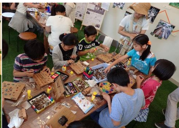
子供たちとのワークショップの様子