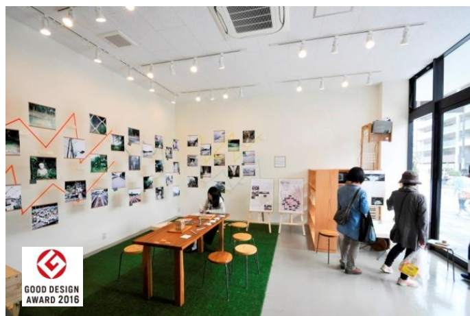
2016年度グッドデザイン賞を受賞した みなまき みんなのひろば（左）とみなまきラボ（右）