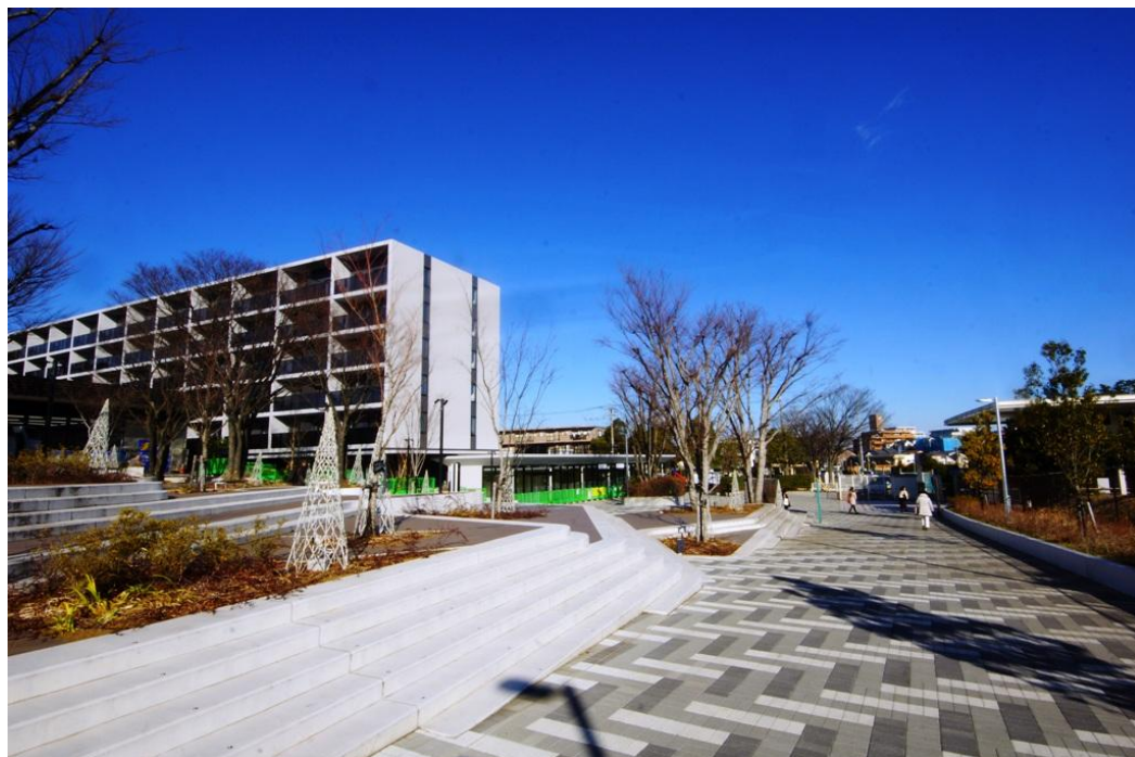
計画認定を受けた「南万騎が原駅周辺リノベーションプロジェクト」