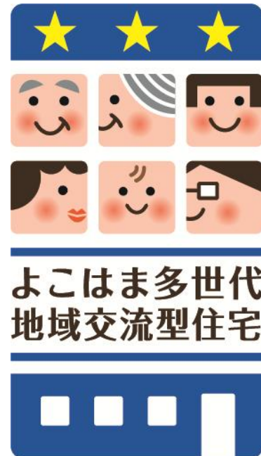
事業ロゴマーク (優良事業A)