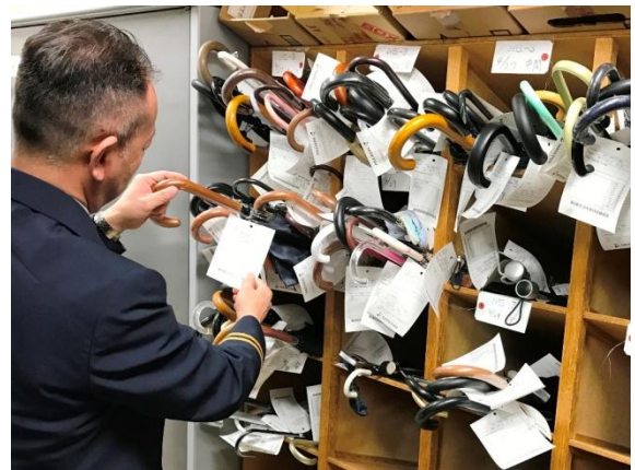
二俣川駅お忘れ物センター

お忘れ物ランキングでは、傘のお忘れ物が最も多く、22,671件（同5.2%減）となり、お忘れ物全体の約27%を占めます。傘のお忘れ物が最も多くなるのが梅雨や台風の時季にあたる6月と9月で、この2カ月で傘の忘れ物全体の約28%を占めます。第2位は袋・封筒類で7,444件（同0.2%増）となり全体の約9%、第3位は現金で5,839件（同10%増）となり全体の約7%でした。お忘れ物の返還は24,477件でお忘れ物全体の28.9%と低いのが現状です。また、珍しいお忘れ物には自転車やかつら、刀等がありました。