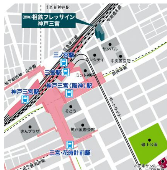
「(仮称)相鉄フレッサイン 神戸三宮」周辺地図