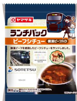
オリジナルパッケージのランチパック (イメージ)

商品名 カステラ10枚入り メーカー 山崎製パン 発売時期 2019年9月予定 ※発売日は未定 ※そうてつローゼンで販売