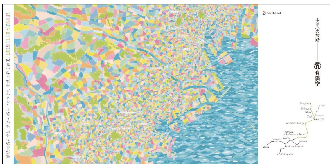
横浜と東京をつなぎ、ひろがるイメージをカラフルに表現したグラフィックデザインのオリジナル文庫カバー (イメージ)