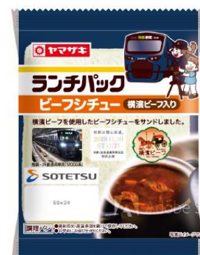
ランチパック 「横濱ビーフの牛ひき肉入りビーフシチュー」（イメージ）