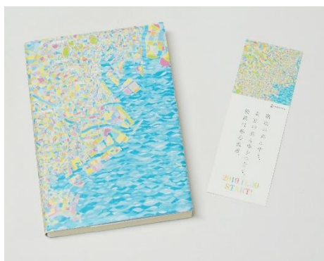
オリジナル文庫カバーとしおり（イメージ）