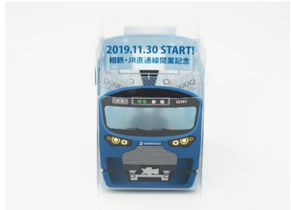
組み立てた状態の「スマホ・ペンスタンド」