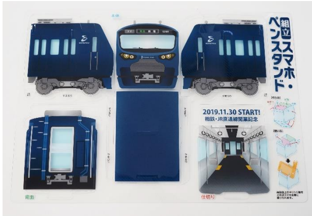
組み立て式「スマホ・ペンスタンド」