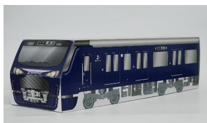
「12000系」をデザインした外箱 (イメージ)

商品名 カステラ10枚入り メーカー 山崎製パン 発売時期 2019年9月予定 ※発売日は未定 ※そうてつローゼンで販売