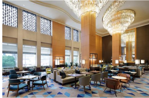
開放的なラウンジ「シーウインド」