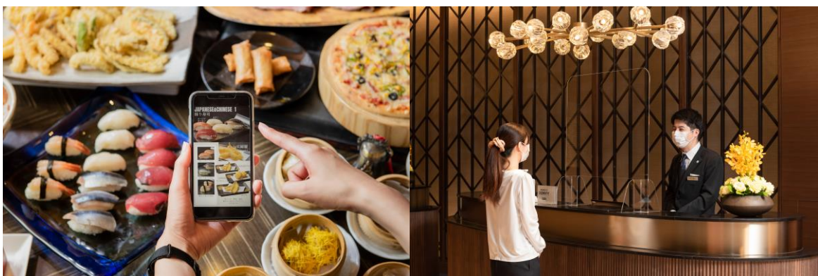
接触・飛沫感染予防に関する対策