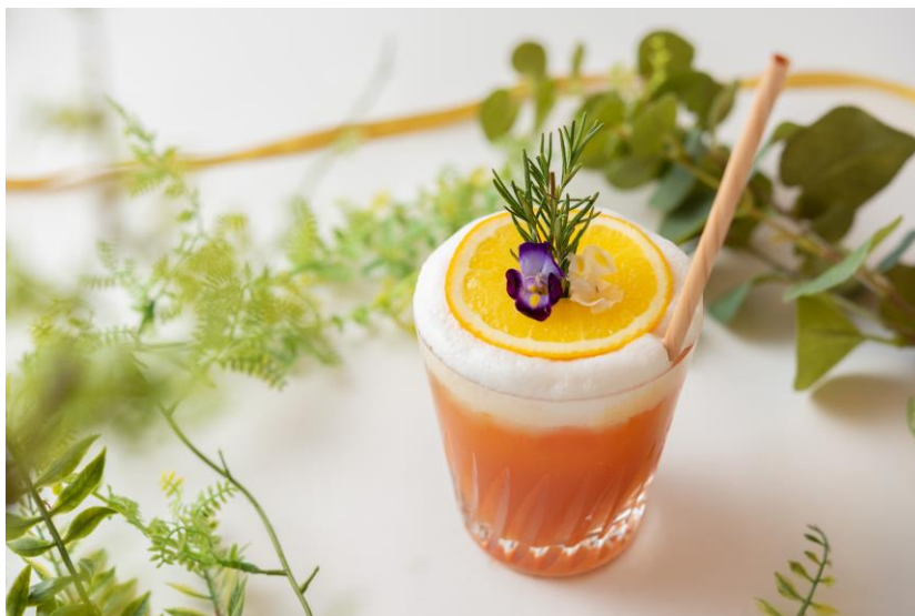
第2弾「ヒーリング フォレスト」

横浜ベイシェラトン ホテル&タワーズはこのプロジェクトに参画することにより、森林環境保全や天然資源の有効活用を推進し、またあらゆる人の活躍に貢献すること等横浜市が掲げるその主旨を広く多くの方々に伝えていきたいと考えております。