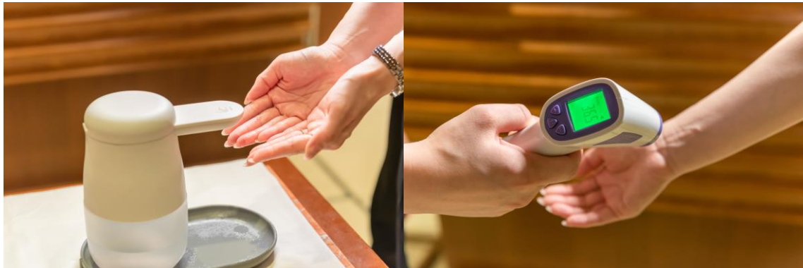
入店時の消毒・検温