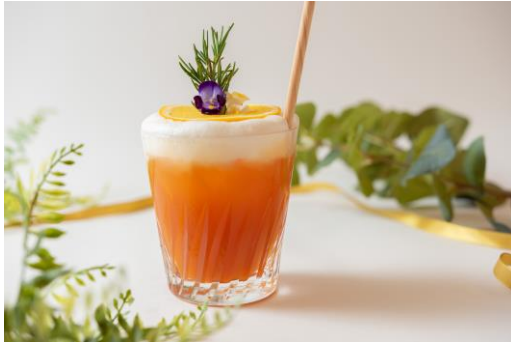
秋をイメージした新テイスト