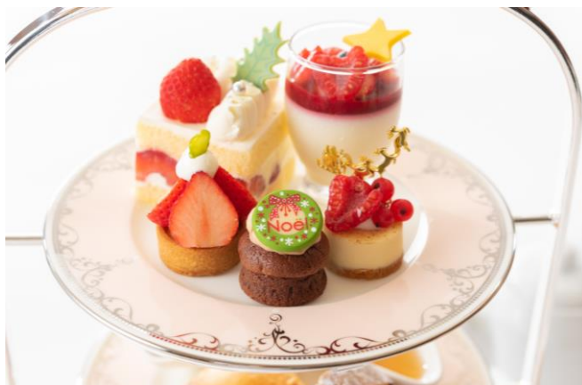
華やかなクリスマスアフタヌーンティー