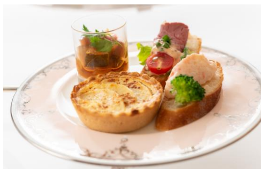
彩り豊かなセイボリー