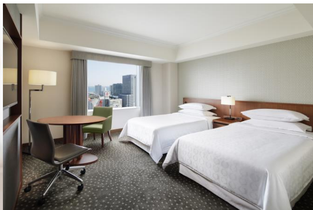
ラグジュアリーフロア客室