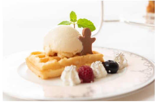
可愛らしいワッフル