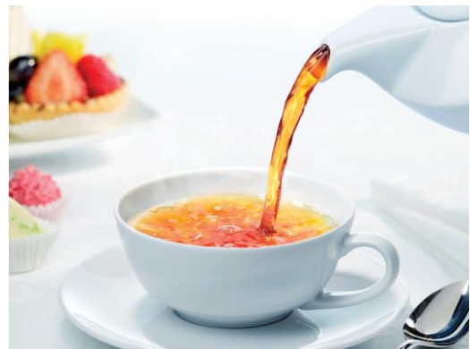
ロンネフェルトティー

※仕入れの状況により、一部料理内容の変更、または盛り付け等が変わる場合がございます。