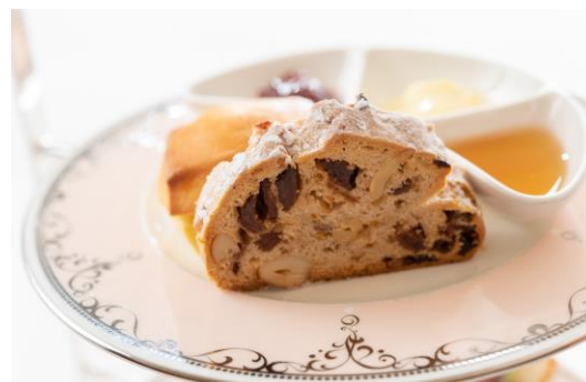
クリスマス限定のシュトレン