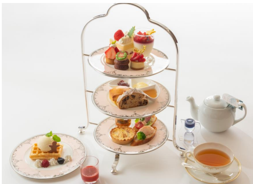
季節のスイーツにこだわったアフタヌーンティーセット(1名様分)

心も体もリフレッシュできる優雅なご褒美ステイで、素敵な自分時間をお過ごしください。