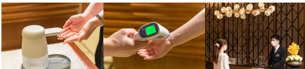
入店時の消毒・検温・接触・飛沫感染予防に関する対策