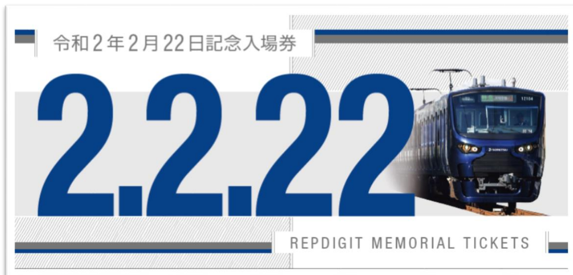
「令和2年2月22日記念入場券セット」台紙（イメージ）