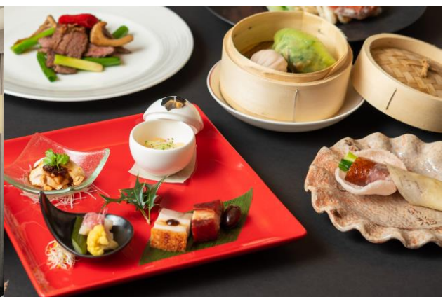
中国料理「彩龍」北京ダック付き限定特別コース（イメージ）