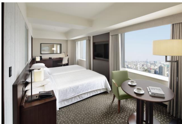
ラグジュアリーフロア(客室)