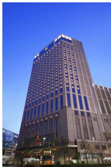
横浜ベイシェラトンは横浜駅西口より徒歩1分