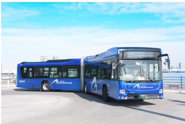
観光に便利な「ベイサイドブルー」号で人気スポットへ

2日目：ホテルブレックファストを堪能→12時のチェックアウト後ラウンジ「シーウインド」でティータイム（ラウンジは地域共通クーポンご利用可能）