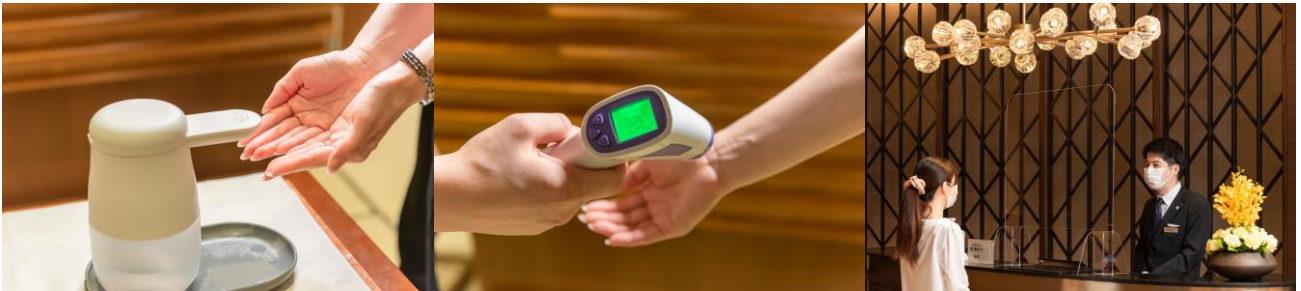
入店時の消毒・検温・接触・飛沫感染予防に関する対策