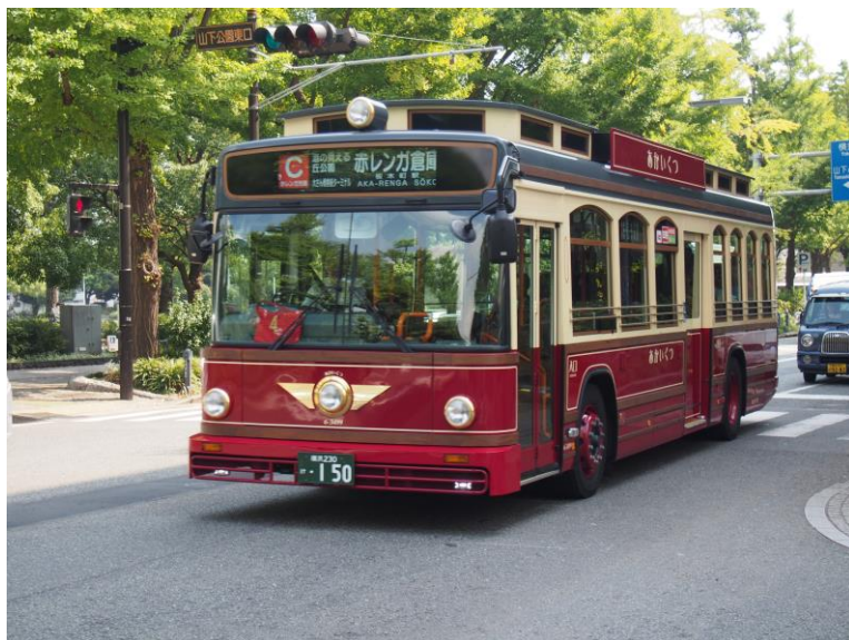
観光に便利な「みなとぶらりチケット」で横浜をひとめぐり

気ままなぶらり旅にぴったりなプランで、ゆったりとヨコハマ港町めぐりを楽しんでみてはいかがでしょうか。