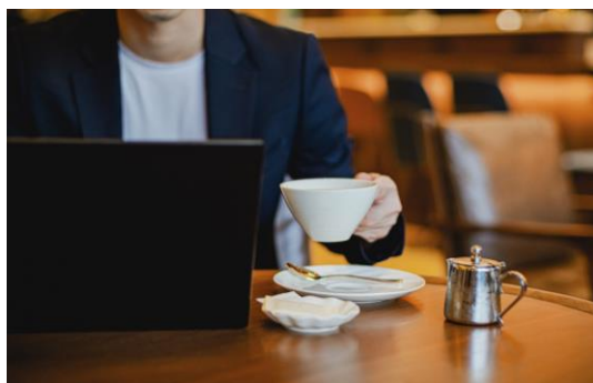
リラックスしながら講習受講が可能（※イメージ）