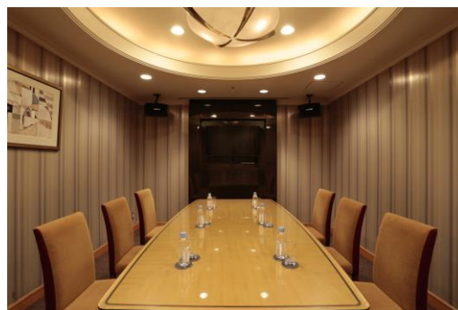
優雅な空間「プライベートファンクショナルルーム」