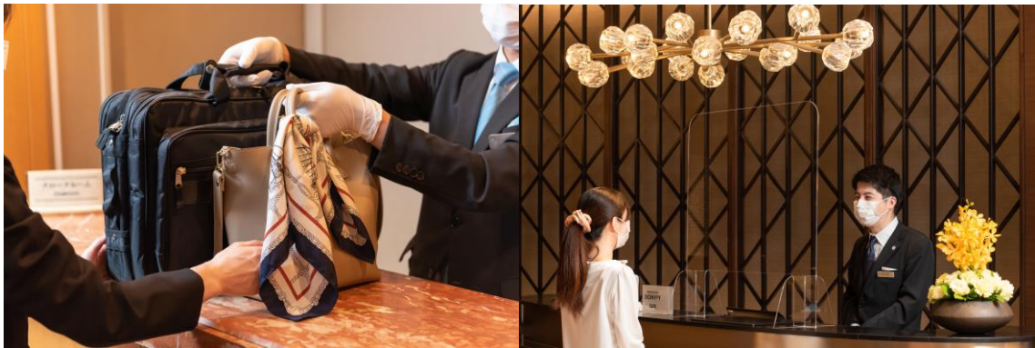
接触・飛沫感染予防に関する対策