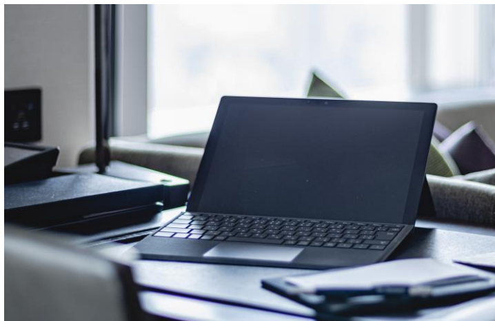
ホテルマンのおもてなし付きパソコン教室 (※写真はイメージ)

温かみのあるおもてなしの中で、習い初めにもぴったりの、横浜ベイシェラトンのパソコンセミナーを是非ご体験ください。