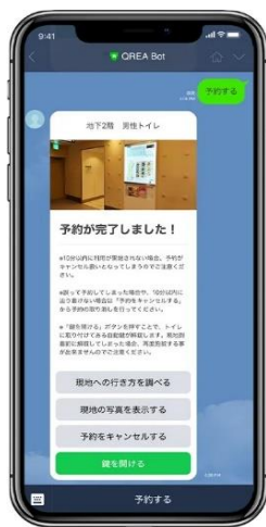
トイレ予約完了画面 (イメージ)