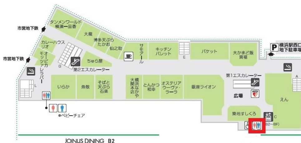
QREA実証実験対象トイレ

※上記実証実験は、今後の新型コロナウイルス感染拡大の状況などにより、変更・中止の可能性がございます。