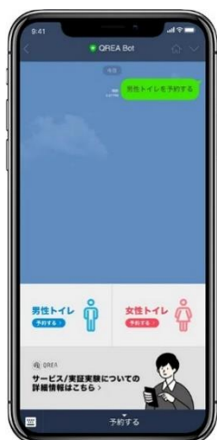
トイレ予約画面 (イメージ)