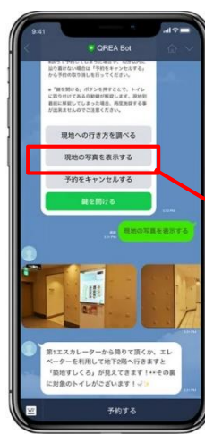
予約後の案内画面 (イメージ)