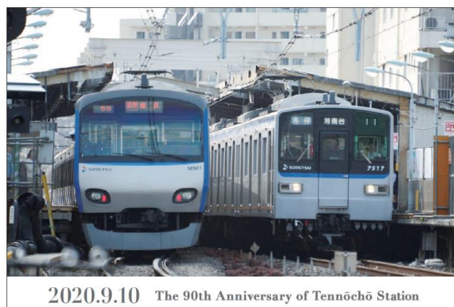
「ポストカード」（イメージ） （2014年撮影）