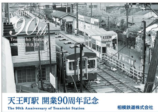
「記念台紙」オモテ面（イメージ） （1966年撮影）