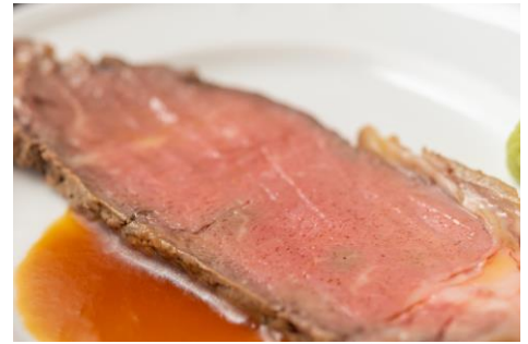
コンパス自慢のローストビーフ

オレンジジュース、ウーロン茶、 コーヒー・紅茶など、ドリンクサービスカウンターにて ご用意しております。 その他、各種ご注文いただけます。