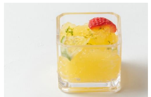
★大分県産 カボスのゼリー