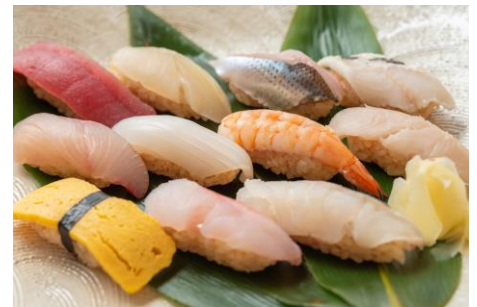
★九州近海の鮮魚を使用した握り寿司