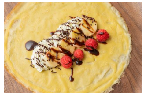
人気の焼きたてクレープ