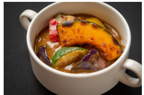
変わらぬ美味しさ 伝統のホテルカレー