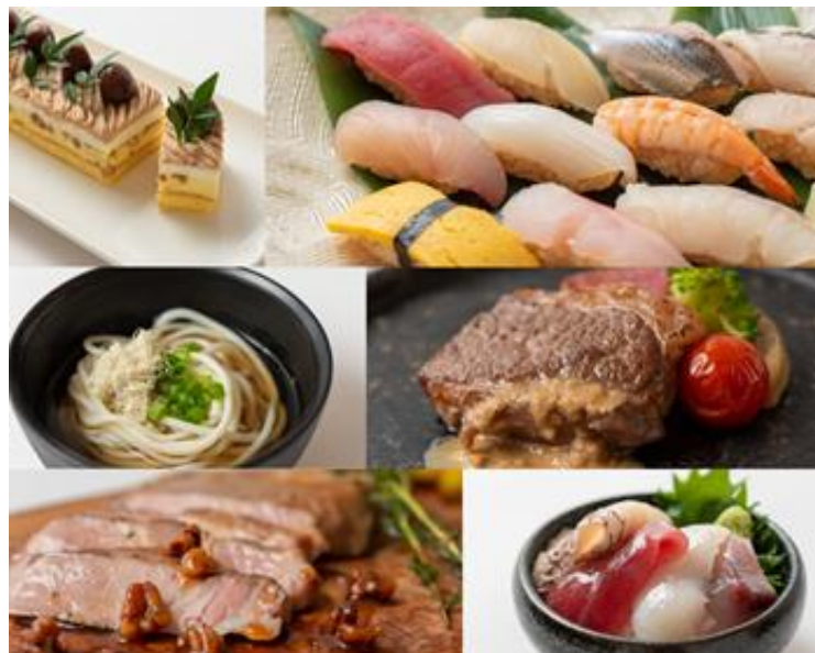
九州地方、大分県の絶品グルメが目白押し

横浜にいながら、日本有数の美食エリア「九州・大分」をグルメ旅行しているかのようなワクワクした気分でお食事をお楽しみください。