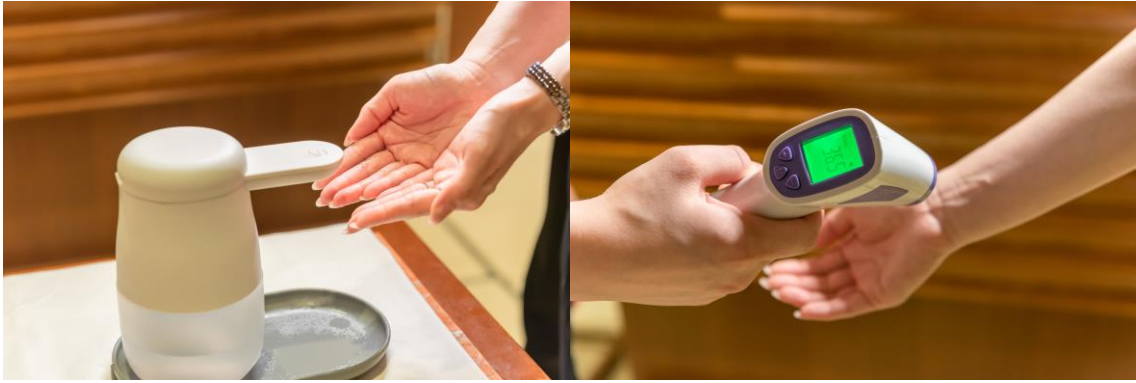
入店時の消毒・検温