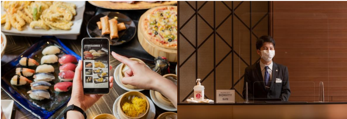
接触・飛沫感染予防に関する対策