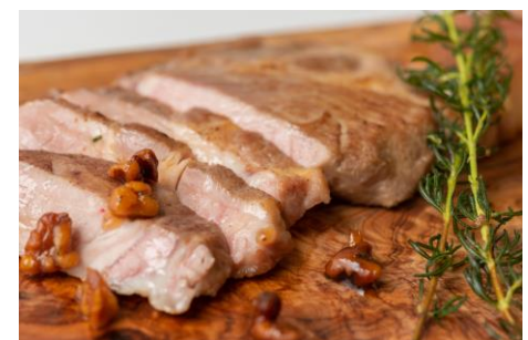
★大分県産 米の恵みポークのソテー