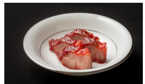
自家製 チャーシュー