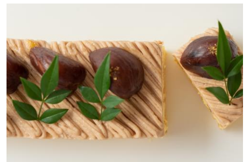
★熊本県産 栗のモンブラン