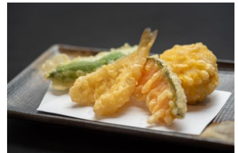
揚げたて 天ぷら盛り合わせ