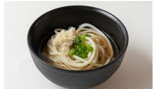
★長崎県名物 五島うどん あごだしスープ