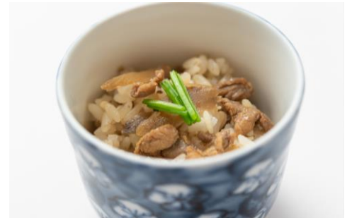
★大分県名物 鶏めし