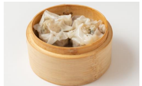
★鹿児島県産 黒豚焼売