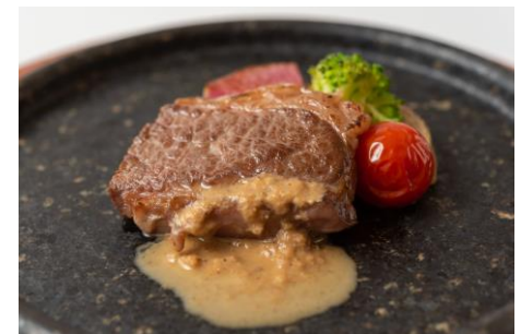
★大分県産 豊美牛の塩麴焼き