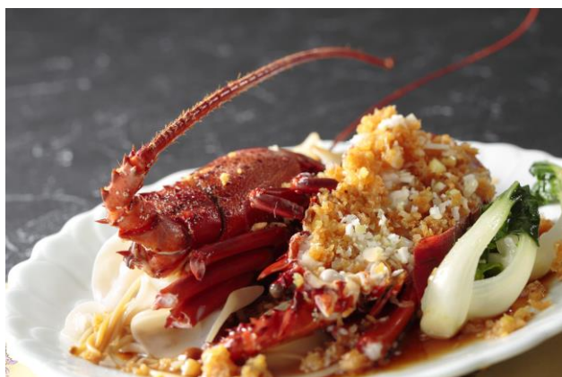
中国料理「彩龍」の本格広東料理

フレンチ「ベイ・ビュー」、中国料理「彩龍」、日本料理「木の花」からお好きなフルコースディナーをセレクトいただける極上プラン。各シェフが厳選した旬の食材を取り揃えた贅沢な料理の数々に心が躍るコース料理をご堪能いただけます。お部屋は、シェラトンが誇るファーストクラスのご滞在をお約束する特別フロア「シェラトンクラブ」(24-27階)をご用意し、クラブフロア専属スタッフによる快適なご滞在のサポートをはじめ、クラブラウンジでのティータイムなど優雅なひとときもお楽しみいただけます。また、バー「ベイ・ウエスト」での食前酒やホテルオリジナル コークシクルボトルなど、お気に入りをお選びいただけるプレゼントもご用意いたしました。