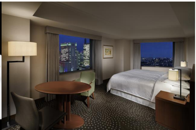
夜景が美しいデラックスキング