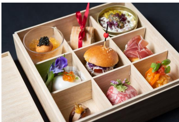
彩り豊かなアミューズボックス

フレンチ「ベイ・ビュー」のシェフが心を込めて作り上げる目にも美しいアミューズボックスとシャンパンをお部屋でご満喫いただけます。贅沢な食材を使用し、上質で洗練されたアミューズが9種類入ったグルメボックスはまさに宝箱のような逸品です。おふたりの大切な記念日のお祝いに、またご自身へのご褒美として、ひとりリッチな気分を味わいたい場面にも最適なプランです。横浜の煌めく夜景とともに素敵な時間をお過ごしください。