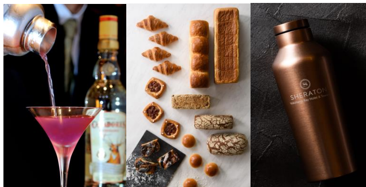
【選べるプレゼント】 メインバーで食前酒 「ドーレ」の焼き立てパン ホテルロゴ入りボトル