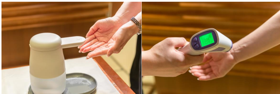
入店時の消毒・検温

●当ホテル内の全レストラン・バーにつきましては、新型コロナウイルス感染防止対策に取り組む店舗・施設として神奈川県へ登録され「感染防止対策取組書」を店頭に掲示するとともに、「神奈川県LINE コロナお知らせシステム」も導入しています。