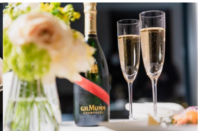
お部屋でゆっくり乾杯