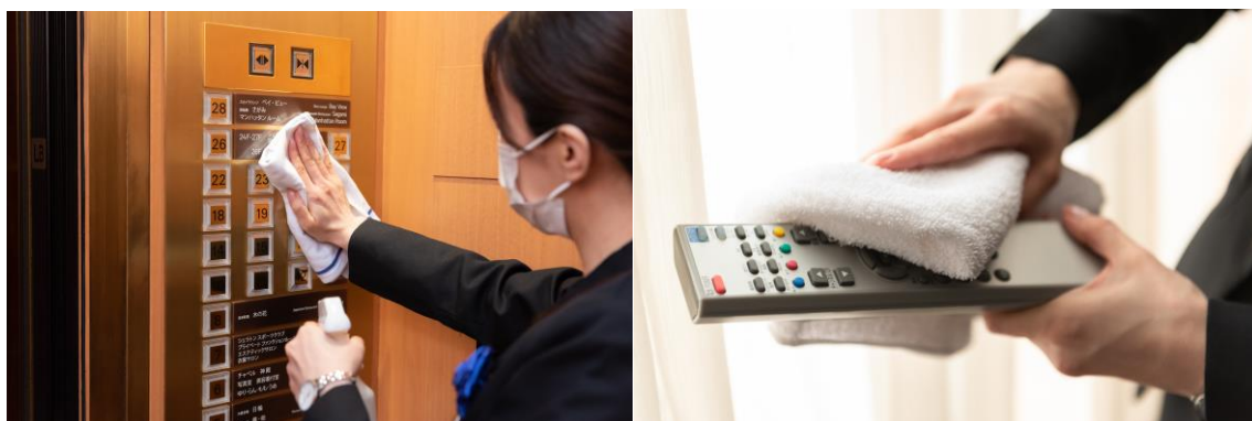
消毒・清掃の徹底