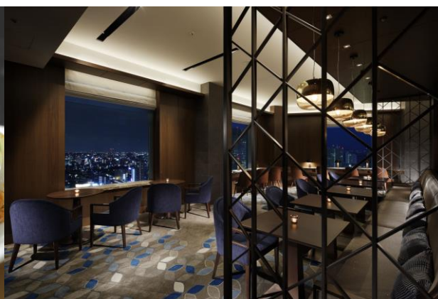
静かなひと時を過ごせるクラブラウンジ