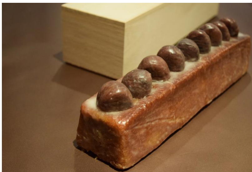
極上和栗のパウンドケーキ「令和 道(れいわのみち)」

お祝いムードを盛り上げると共に、縁起ものとしてもご贈答用にも相応しい、至福の味わいを心行くまでお楽しみください。