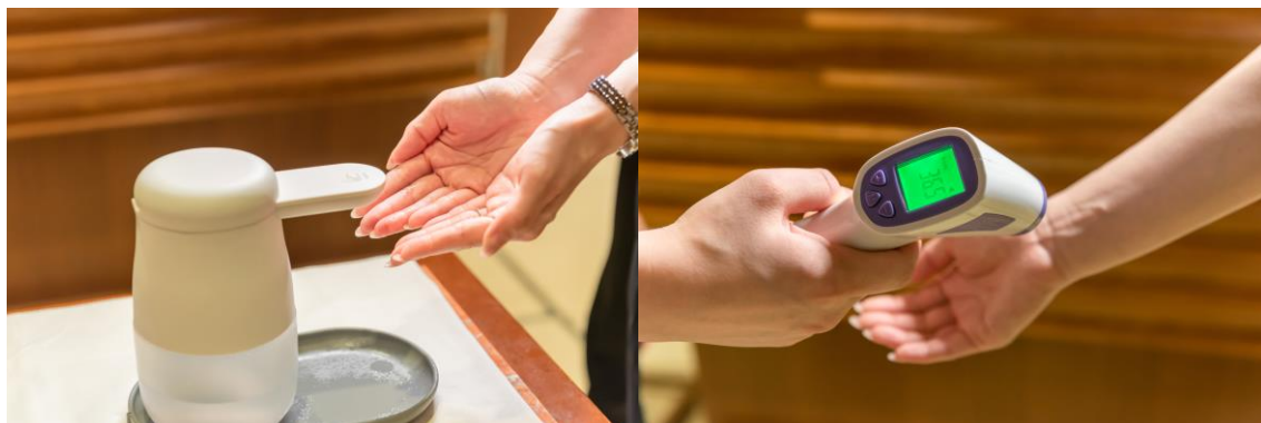
入店時の消毒・検温