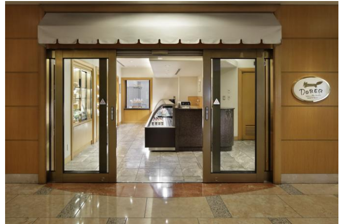
ペストリーショップ「ドーレ」