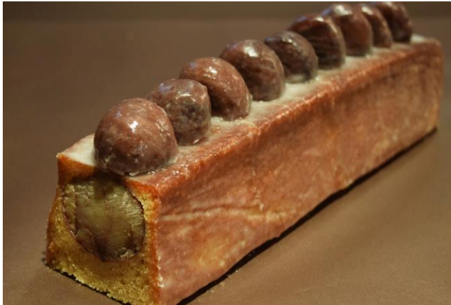
大粒の「熊本県やまえ 利平栗」が丸ごと10個入り

ケーキ中身には大粒の「熊本県やまえ 利平栗」が丸ごと10個入り、更にトッピングにもハーフポーションの同利平栗が9個デコレーションされた豪華な焼菓子です。