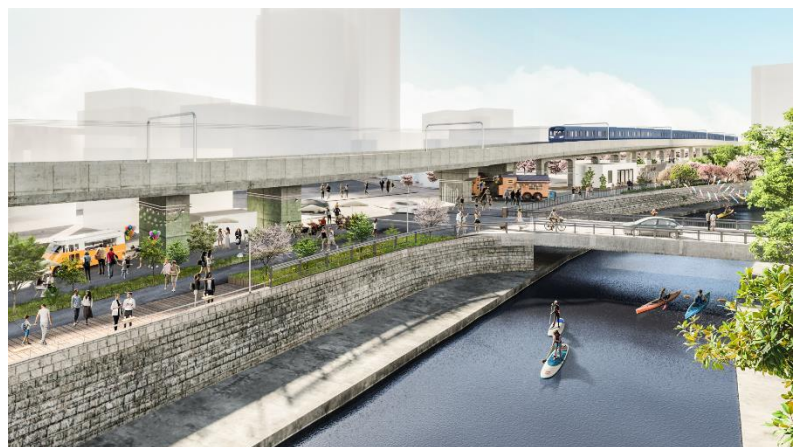
高架下空間の開発イメージ