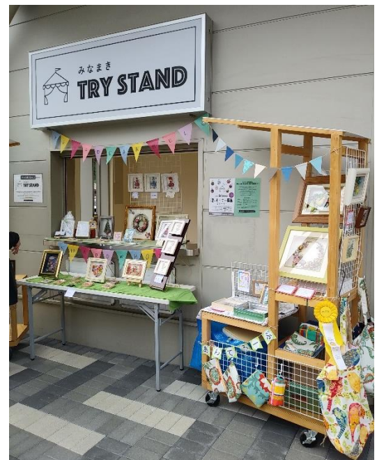
「みなまき TRY STAND」の様子

主に横浜市内を対象地域とする、新しい暮らし方に対応した地域の課題解決と、SDGsが掲げる17ゴールの達成に必要な事業費を補助する制度です。