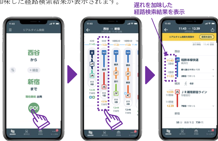
「リアルタイム経路検索」画面図（イメージ）

今回、相模鉄道(株)との連携開始により、JR東日本アプリにおいて、相鉄線が含まれる経路検索結果に、遅れなどの運行情報を加味した経路検索結果が表示されます。