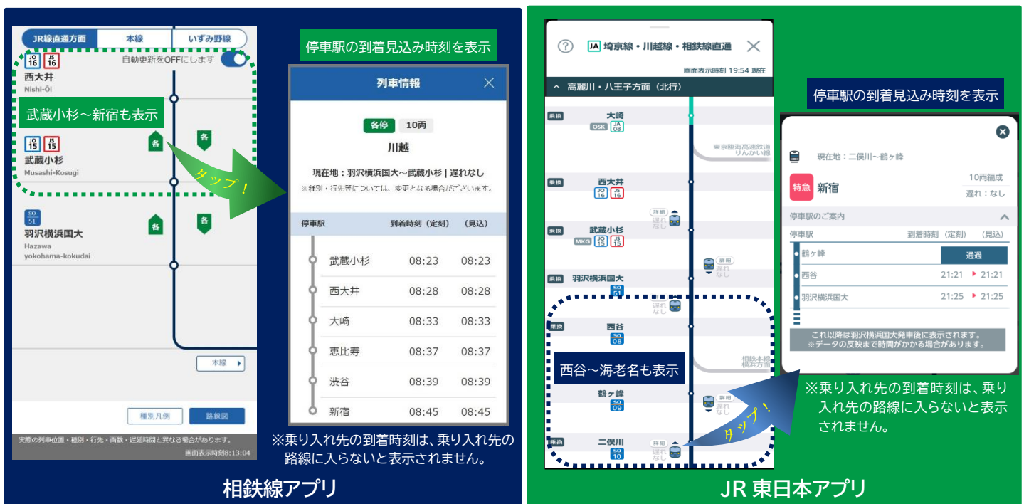
列車走行位置と時刻表示の画面図 (イメージ)