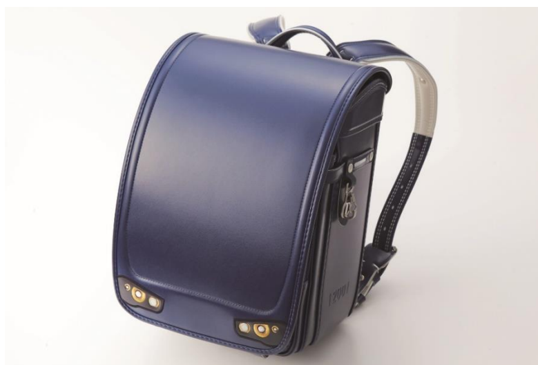
「相模鉄道デザインランドセル 12000系」