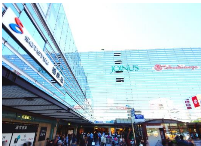
横浜駅西口の商業施設・相鉄ジョイナス