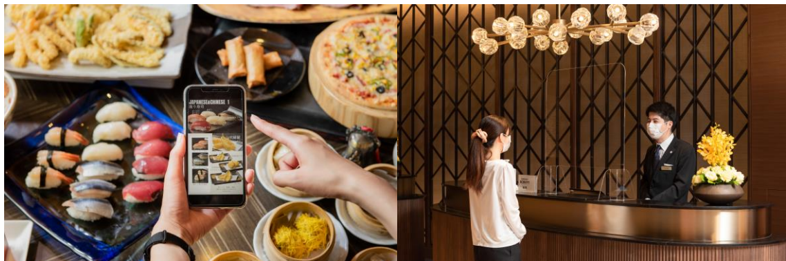
接触・飛沫感染予防に関する対策