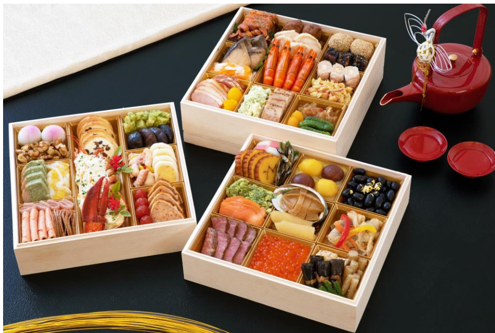
2023年は新たなラインナップが加わった5種類の豪華おせち料理が新登場

コロナ禍にて行動制限のない今、今年大切な方々と久しぶりに集い、温かな団らんを囲むお正月になりますことを心より願い、ご自宅用にはもちろん、遠く離れた方への贈り物としても最適な横浜ベイシェラトンの特製おせち料理を是非ご賞味ください。