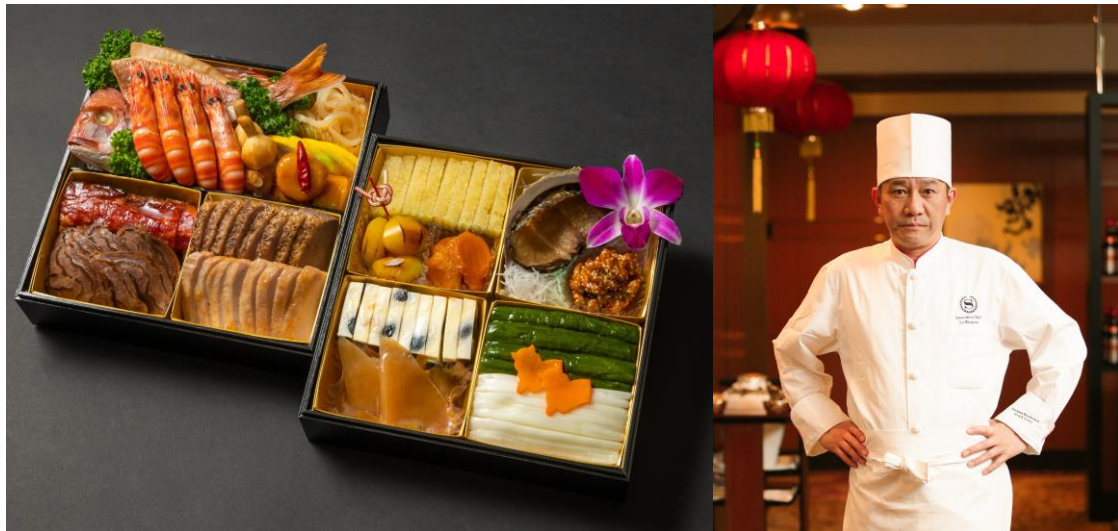
本格的な味わいをご堪能いただける特製中華おせち