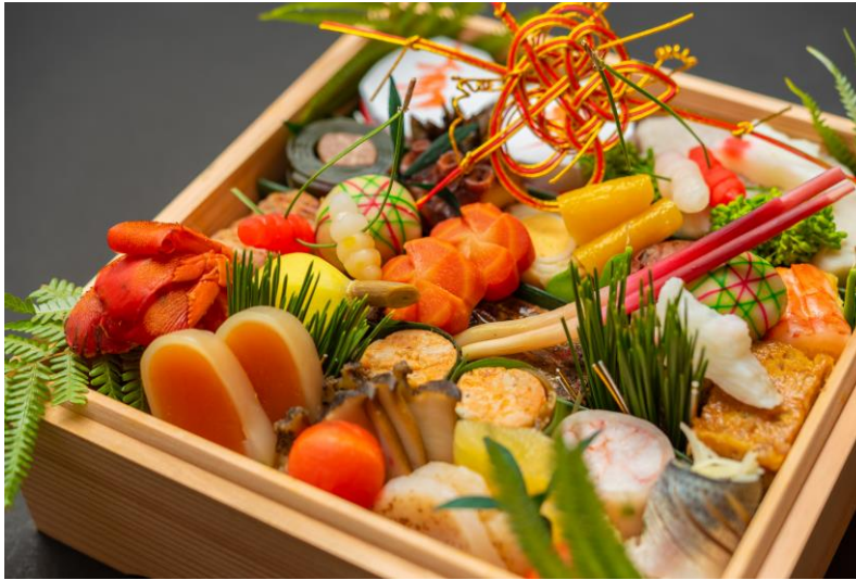
厳選素材を贅沢に使用した日本料理「木の花」特製おせち