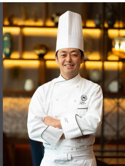
ホテル総料理長 磯貝 徹監修の彩り豊かな「和・洋・中おせち一段重」