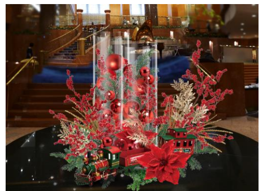
(株)竹中庭園緑化デザインの華やかなクリスマス装飾