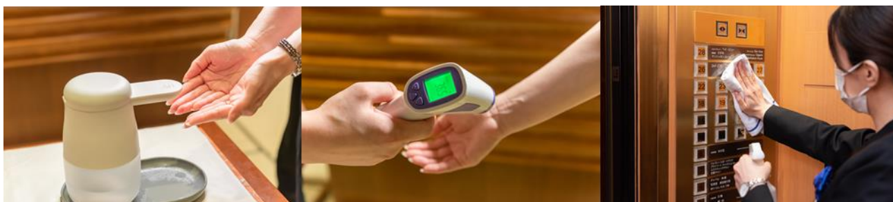
入店時の消毒・検温、館内施設における消毒・清掃の徹底