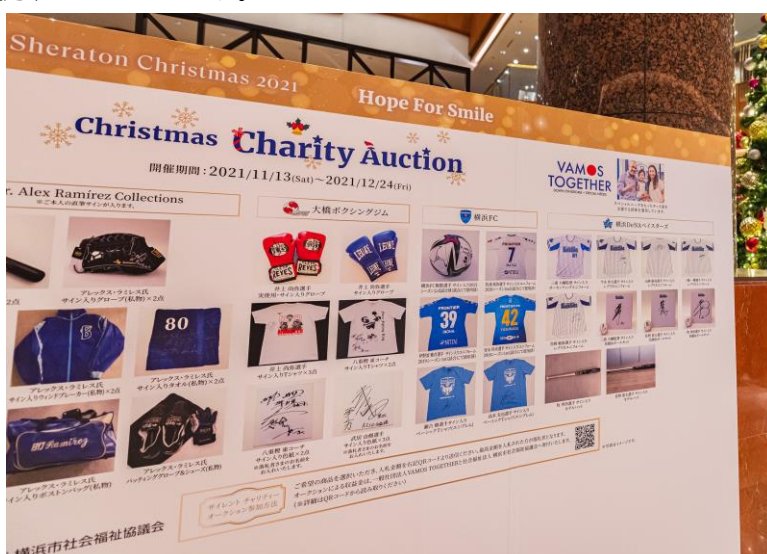
“Jubilation”をテーマにしたクリスマスツリー 数多くの出品品が出揃うチャリティーオークション(※画像は 2021 年のオークションボード)