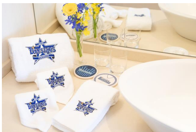
バスルームでの身支度も楽しくなるアメニティー類