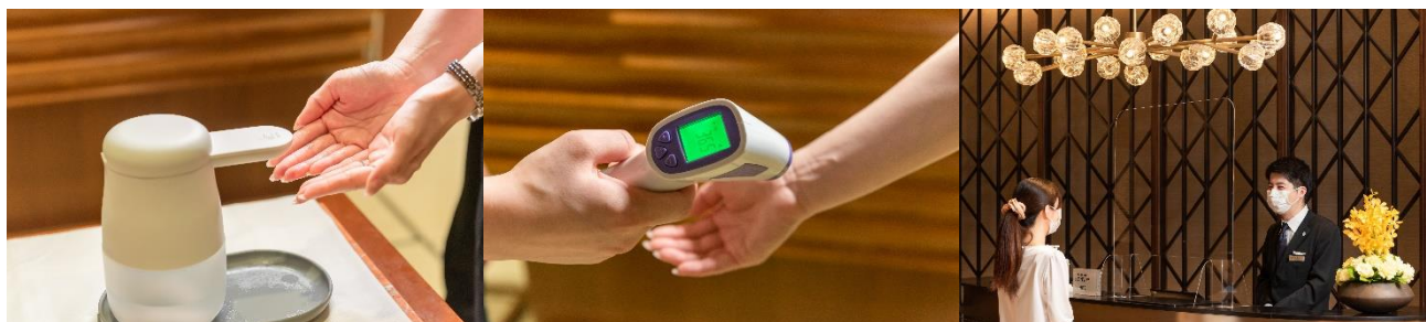
入店時の消毒・検温・接触・飛沫感染予防に関する対策