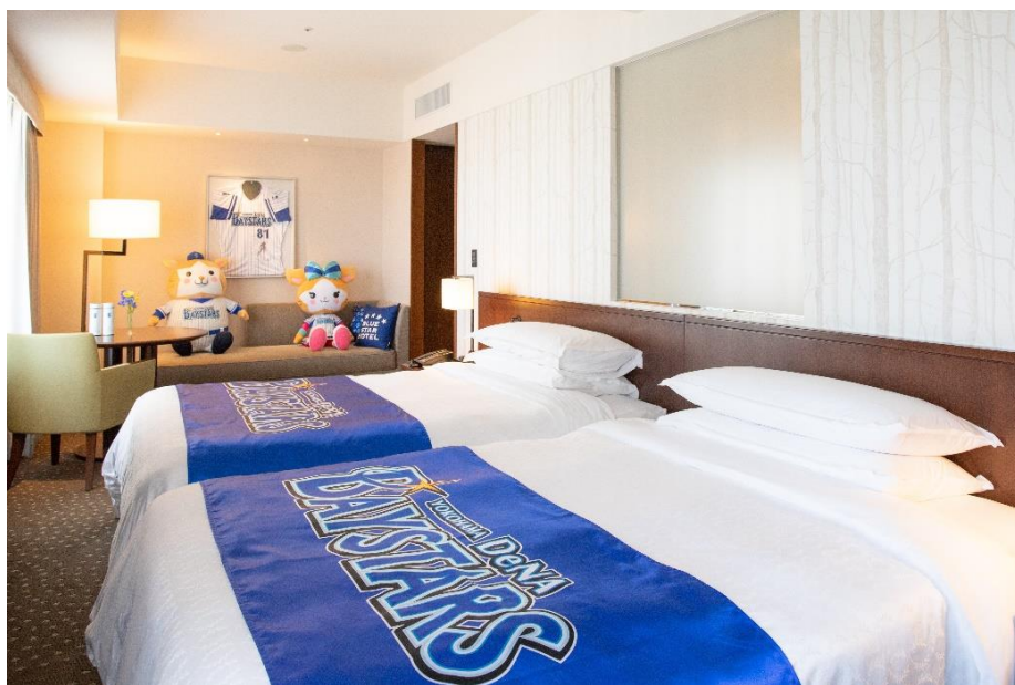
横浜 DeNA ベイスターズをテーマにした魅力的なコンセプトルーム

横浜 DeNA ベイスターズ公式戦の観戦チケット付き宿泊プランのほか、ご宿泊のみでもご利用可能です。野球ファンの皆さまはもちろんのこと、エンターテイメント性が高い「横浜 DeNA ベイスターズ コンセプトルーム」は、春休みやゴールデンウィークなど暖かくなるシーズンを目前に、大人も子供も楽しめるご旅行プランにも最適です。また、フォトジェニックなお部屋は、大切な方の記念日ステイにもぴったりな心に残るご滞在をご体験いただけます。