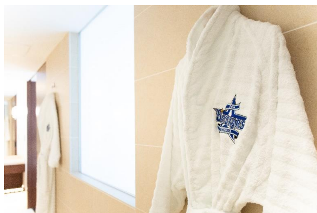
着心地がよいオリジナルバスローブ