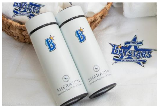
宿泊特典 オリジナルマグボトル(非売品)

※ご朝食はオールデイブッフェ「コンパス」にて神奈川朝食三浦産の新鮮野菜や相模湾近郊で獲れた本カマスの干物、湘南しらす、横浜中華街の名店「大珍楼」の豚肉焼売等、地産地消の良質食材や名産品を取り揃えたこだわりのメニューです。