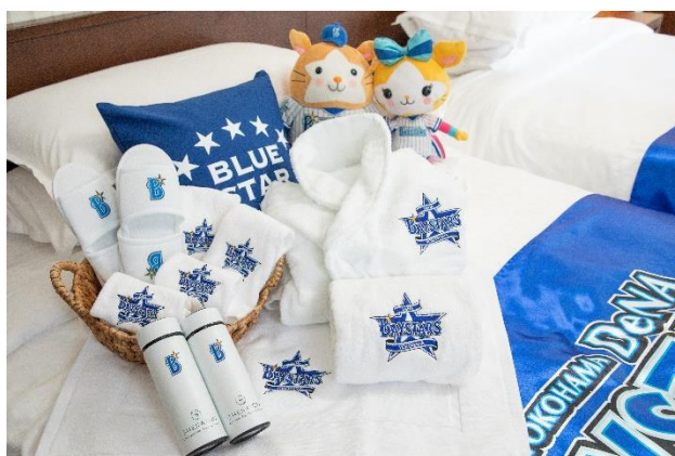
横浜 DeNA ベイスターズのロゴ入りグッズが勢ぞろい