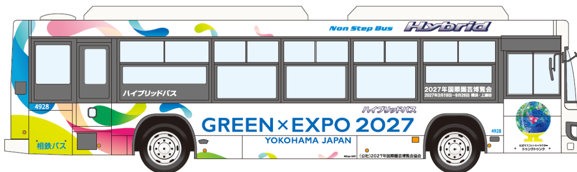
「GREEN×EXPO 2027」ラッピングバス（イメージ）