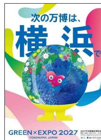
掲出予定のポスター（イメージ）