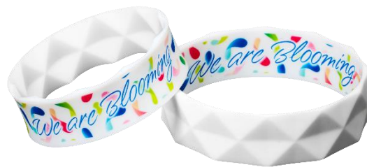
ブルーミングリング

本プロジェクトでは、GREEN×EXPO 2027の応援のシンボルとして、Blooming RINGを配布いたします。「We are Blooming」を合言葉にBlooming RINGを装着し、応援の意を込めた「Bloomingポーズ」をとることで、皆さまの“応援の輪”を可視化し、GREEN×EXPO 2027開催への盛り上げを育ててまいります。