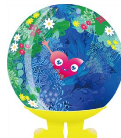
公式マスコットキャラクター 「トゥンクトゥンク」