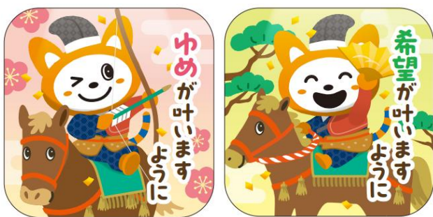
そうにゃんピンズ（イメージ） 【（左：ゆめが丘駅）（右：希望ヶ丘駅）】