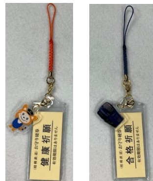
ゆめきぼホルダー (左：そうにゃん 右：13000系) ※切符は別売りです

キャンペーン期間中は、両駅に絵馬掛けを設置します。結んでいただいた絵馬は、キャンペーン終了後に祈願成就のため、寒川神社に奉納します。