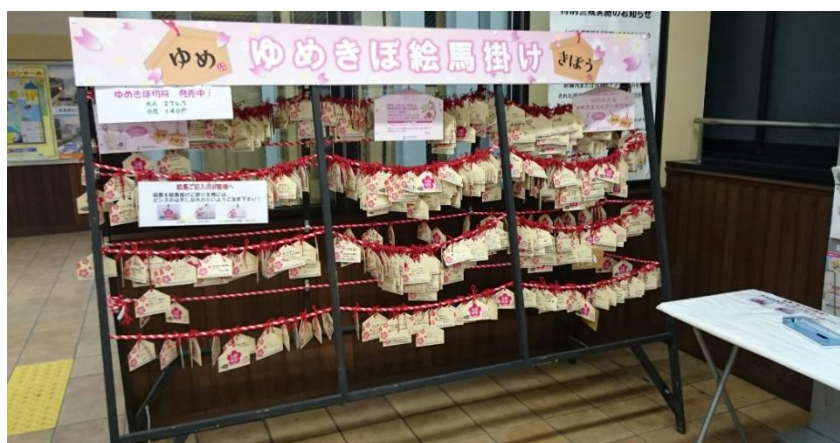
絵馬掛け（イメージ）