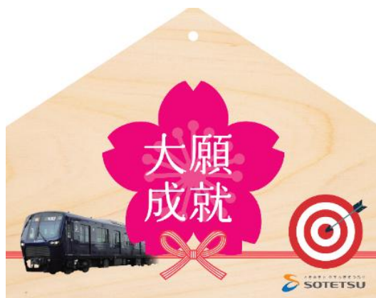
オリジナル絵馬（イメージ）