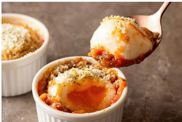
ラタトゥイユとポーチドエッグのココット焼き