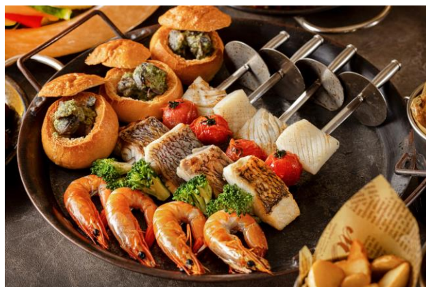
海老とイカのブロシエット