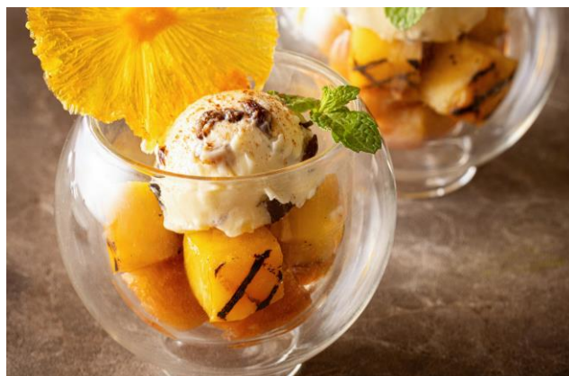
グリルドパイナップルのキャラメリゼ ラムレーズンアイス