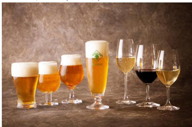
冷たい生ビールや赤白ワインなど充実のフリーフロー