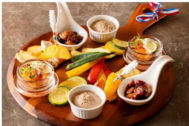
スモークサーモンのタルタルなどの冷製オードブル