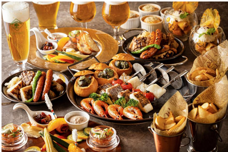
フレンチシェフが手掛ける特製料理と冷たいビールの夏の饗宴

お仕事帰りの暑気払いや、ご友人との気心知れたお集まりなどに最適な大人時間をゆっくり過ごせる場所。ホテル最上階の特等席から横浜の夜景を眺めながら、今年の夏にとっておきの一夜をスカイラウンジ「ベイ・ビュー」にて涼やかに過ごしてください。