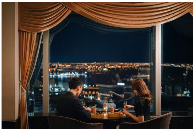
横浜の景観が美しいホテル最上階の スカイラウンジ「ベイ・ビュー」