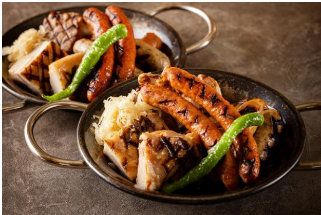
ソーセージ・あべどり・国産ポークのグリルアソート