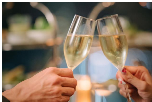
華やかなスパークリングワイン