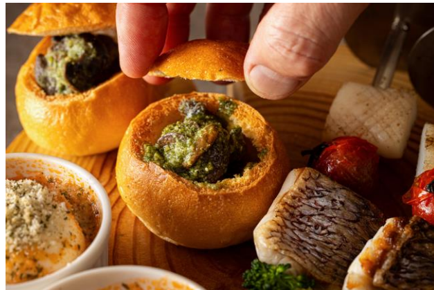
エスカルゴ ブルギニオン パンの器仕立て