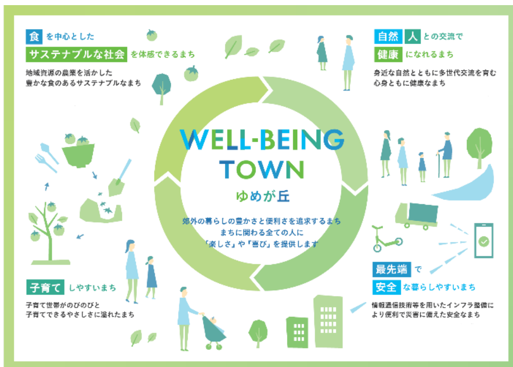
ゆめが丘のコンセプト「WELL-BEING TOWN ゆめが丘」

大規模複合商業施設「ゆめが丘ソラトス」、「ゆめが丘総合病院」、住宅などが整備されたゆめが丘地区において、持続可能なエリアマネジメントを推進しています。エリアにおけるコンセプト「WELL-BEING TOWN ゆめが丘」のもと、“「食」を中心としたサステナブルな社会を体感できるまち”、“「自然」「人」との交流で「健康」になれるまち”、“「子育て」しやすいまち”、“「最先端」で「安全」な暮らしやすいまち”を目指し、地域と連携したにぎわいの創出や、シビックプライドの醸成を図ります。