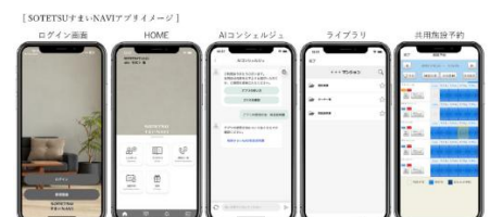
SOTETSU すまい NAVI (イメージ)