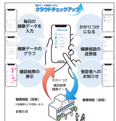
クラウドチェックアップ (イメージ)

KNOCKS ゆめが丘（賃貸マンション）、グレーシアライフ横浜ゆめが丘（分譲一戸建て）に導入しています。