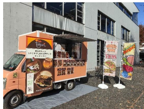
キッチンカー「tomori」(イメージ)