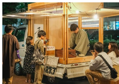
二畳建築(イメージ)