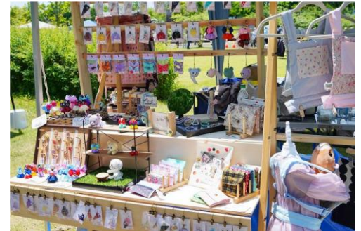
フリーマーケット(イメージ)

内 容：リサイクルに関心を持ち、環境問題改善への協力や身近な物の製造者に対して感謝することを目的に、FP TEENSのメンバーや商店街の方々の不要になったものをフリーマーケットとして無料で提供。不要になったものにはその当時の思い出や、次に使う人へのメッセージをポップで表示。