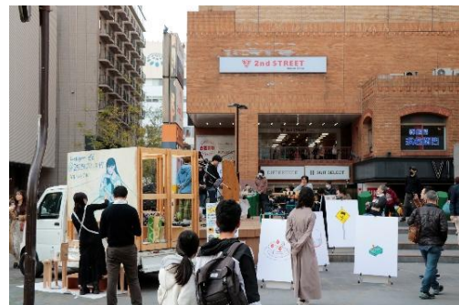
イベント当日(イメージ)

内 容 : 「会話するカフェ」をコンセプトに、飲むことと楽しむことをテーマにした体験・空間を提供する、慶応 SFC 生が設計・運営する革新的なキッチンカー。今回はキッチンカーによる出店ではなく、屋台にてハンドドリップによるコーヒー抽出体験を行う。