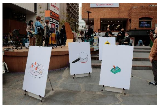
家庭環境データ展示(イメージ)