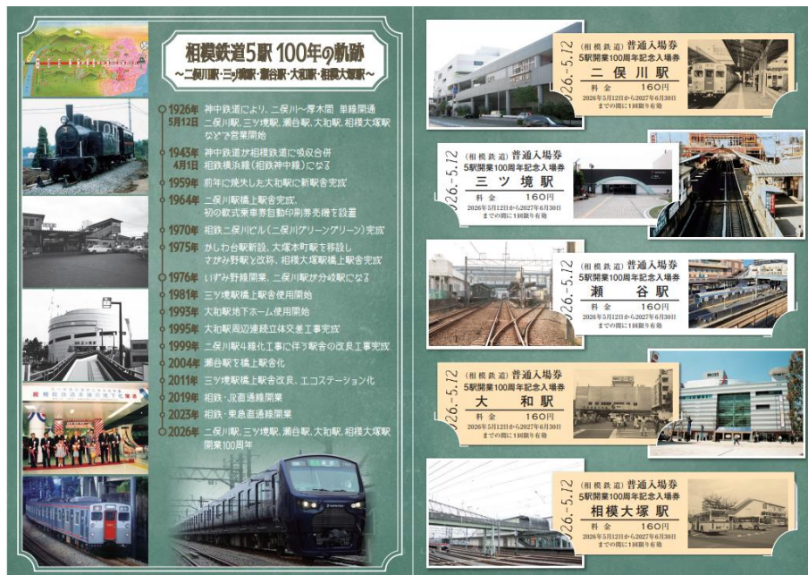
「5 駅開業 100 周年記念入場券セット」 (中面・イメージ)