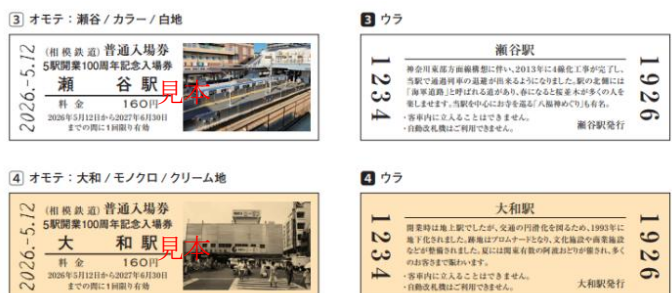
「5 駅開業 100 周年記念入場券セット」 瀬谷駅・大和駅 (入場券・イメージ)