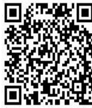
X (旧 Twitter)