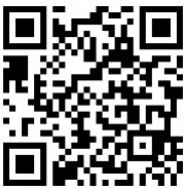
X (旧 Twitter)