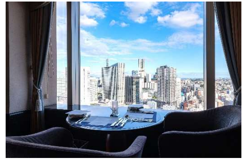
スカイラウンジ「ベイ・ビュー」(28F)