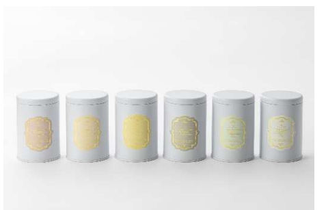
20種類の茶葉が揃うティーセレクション 「アムシュティー」