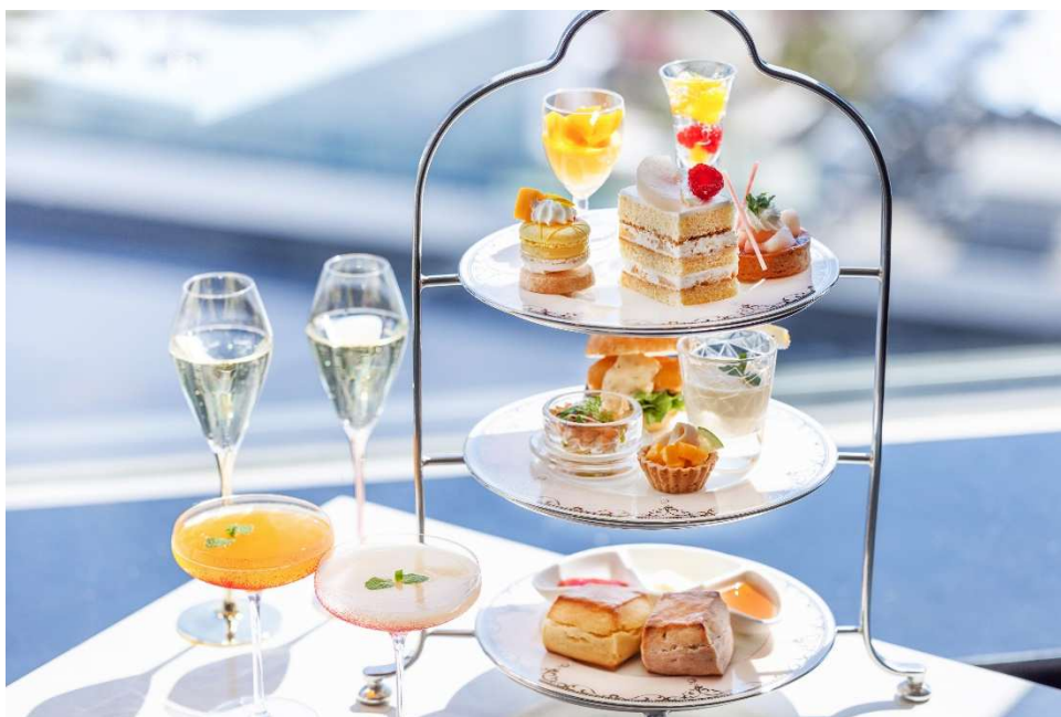
旬の桃とマンゴーを楽しむ「ベイ・ビュー」のアフタヌーンティーセット

スパークリングワインのフリーフローや20種類のティーbuffetとともに、最上階から望む美しい横浜港やベイブリッジのパノラマビューを背景に、夏の昼下がりをお優雅にお過ごしください。