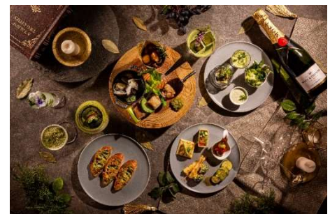
新緑の季節を彩るイブニングハイティー