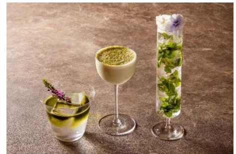
グリーンが美しいカクテルやモクテル