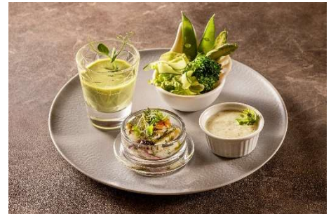
爽やかな色合いの各種アペタイザー