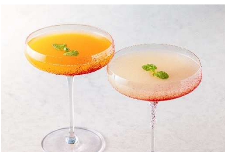
爽やかなマンゴーやピーチのカクテル