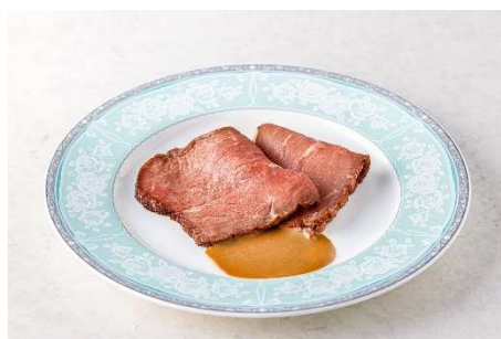
ジューシーなローストビーフ