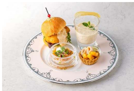
桃やマンゴーを使用したセイポリー