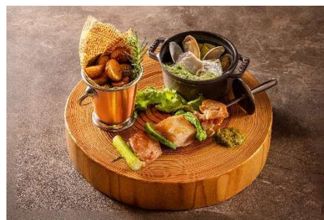
魚介のココット蒸しや もも肉のプロシエット