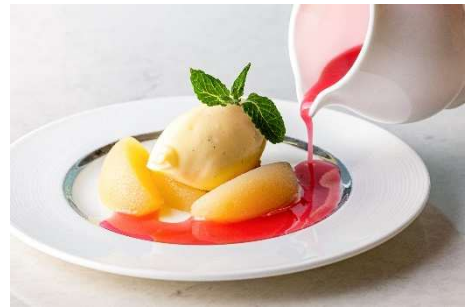
土日祝限定 「ピーチジュビレ」 温かい桃のコンポートとバニラアイス