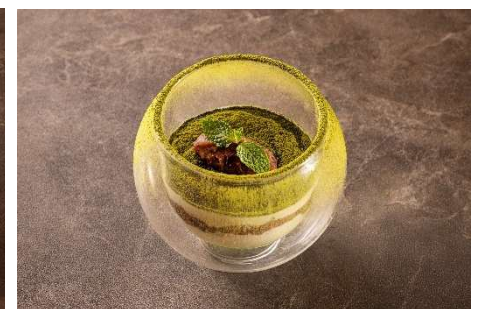
抹茶ティラミスヴェリーヌ