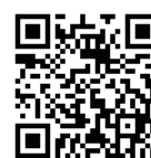
公式ウェブサイト